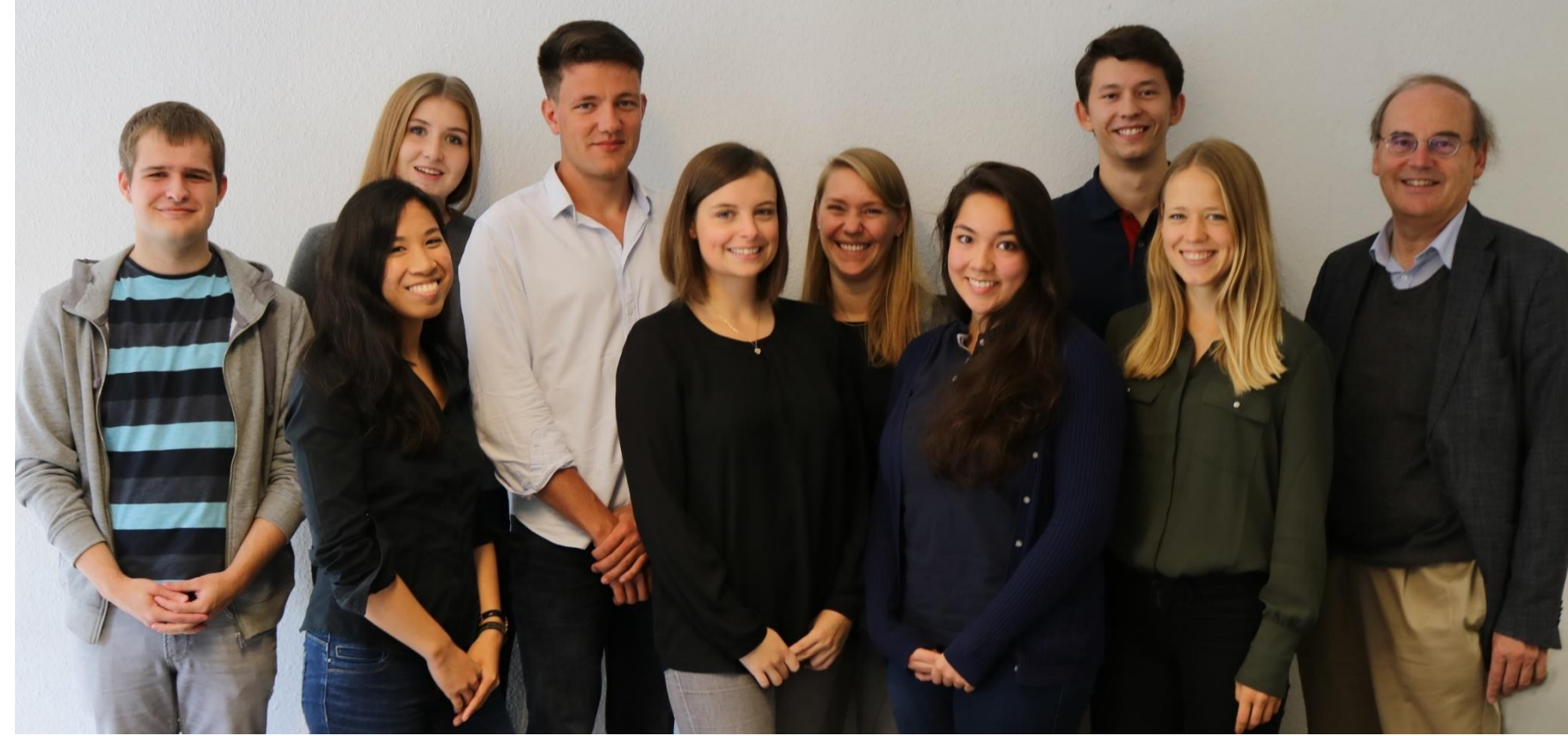
Das FlipOS Team

Der Fokus des Projekts liegt auf der Neugestaltung des Bachelormoduls MSS1 -Business Intelligence . Das Projekt wird im Rahmen der "LehrZeit"-Ausschreibung der Universität Osnabrück zur Unterstützung des Qualifikationsziels „Individuelle Profilbildung und Professionalisierung“ im Zeitraum vom 01.10.2018 bis zum 31.09.2019 gefördert.